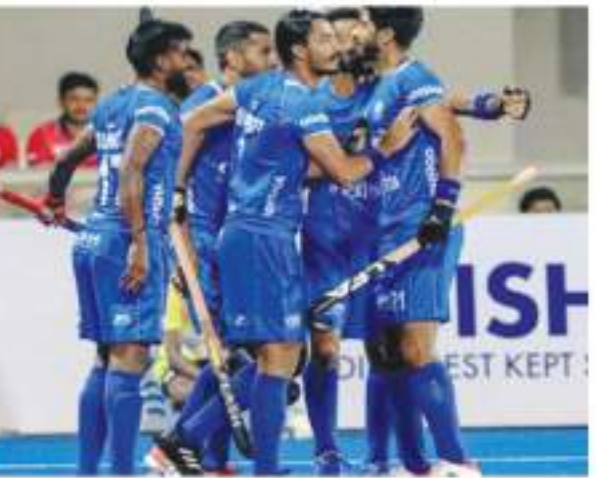
होना। एशियाई चैंपियन्स ट्रॉफी 2023 चेन्नई में अगस्त में होने वाली है जिसके बाद चीन के हंगझो में एशियाई खेल 2023 होंगे। यह हमारे लिए आगामी महीनों के लिए अपनी तैयारी शुरू करने और जिस तरह की हॉकी हम खेलना चाहते हैं उसे प्रदर्शित करने के लिए एक महत्वपूर्ण शिविर है।