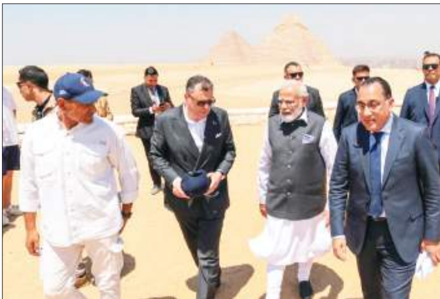
प्रधानमंत्री नरेंद्र मोदी ने मिस्त्र के पिमामिडों को देखा।

कानपुर: कभी ईमेल पर तो कभी एसएमएस के द्वारा या फिर कभी लुभावने ऑफर दिखाकर लोगों को ठगी के जाल में फंसाने वाले साइबर अपराधी नित नए तरीके इजाद कर रहे हैं। अपने दिन का अधिकांश समय सोशल मीडिया और मोबाइल फोन पर बिताने वाले युवाओं को साइबर ठगी के नए हथकंडों से बचने के लिए पुलिस कमिश्नर कानपुर नगर की क्राइम ब्रांच साइबर सेल अवेयरनेस प्रोग्राम चला रही है। साइबर अवेयरनेस सेशन में शनिवार को कल्याणपुर के कोचिंग संस्थान में छात्र छात्राओं को जागरूक किया गया। छात्रों के साथ कोचिंग में पढ़ा रहे शिक्षकों ने भी जागरूकता अभियान में भाग लिया।