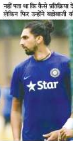
नहीं पता था कि कैसे प्रतिक्रिया दें, लेकिन फिर उन्होंने बल्लेबाजी की

जाया कि अगर मेरे साथ ऐसा होता तो कैसे होता?' मैं मैदान पर नहीं गया होता। ईशांत ने इसके बाद कोहली के अन्य चरणों को याद किया और स्वीकार किया कि भारत का यह स्टार बल्लेबाज अपने करियर में महत्वपूर्ण बदलावों से गुजरा है। उन्होंने कहा, 'मैंने उनके सभी चरण देखे हैं। पार्टी से लेकर टैटू तक, फिटनेस फ्री से लेकर एक टॉप परफॉर्मर तक, उन्होंने अपने करियर में बड़े पैमाने पर बदलाव किया है। उन्हें पार्टियों का शौक था और कोलकाता में एक टूर्नामेंट के दौरान उन्होंने पूरी रात पार्टी की लेकिन अगले दिन उन्होंने 250 रन बनाए। वह पिछले दिन नाबाद थे और हम अंडर-19 क्रिकेट में दिल्ली का प्रतिनिधित्व कर रहे थे।'