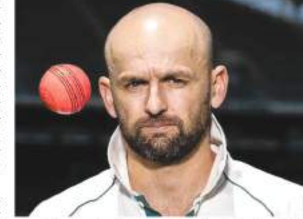
लगाता है कि मेरा परिवार बिल्कुल अद्भुत रहा है, उनका समर्थन और प्रार और देखभाल ने मुझे यहाँ तक पहुंचाया। ऑस्ट्रेलियाई स्पिनर टेस्ट क्रिकेट में 500 विकेट की उपलब्धि हासिल करने से पांच विकेट दूर है। लियोन ने कहा कि 500 टेस्ट विकेट ले चुके हैं। मैं जानता हूँ कि मैं बहुत भाग्यशाली रहा हूँ और अब तक की अपनी यात्रा के लिए आभारी हूँ। यह अद्भुत रहा है और अगर मैं एशेज में बकिया प्रदर्शन करने में सफल रहा तो यह काफी खास होगा।

लंदन। ऑस्ट्रेलियाई स्पिनर नाथन लियोन लंदन के लॉर्ड्स में आगामी दूसरे एशेज टेस्ट में एक बड़ा रिकॉर्ड बनाएंगे। लॉर्ड्स टेस्ट में उतरते ही वह ऑस्ट्रेलिया की ओर से लगातार 100 टेस्ट खेलने वाले स्पेशलिस्ट गेंदबाज बन जाएंगे। 2013 के बाद से 35 वर्षीय लियोन ने 99 टेस्ट खेले हैं। उनसे पहले 5 क्रिकेटर लगातार 100 या इससे ज्यादा टेस्ट खेल चुके हैं। एलिस्टर कुक (159), एलन बॉर्डर (153), मार्क वॉ (107), सुनील गावस्कर (106) और ब्रैंडन मैकुलम (101)। नया रिकॉर्ड बनाने पर लियोन ने कहा कि यह कुछ ऐसा है जिस पर मुझे वास्तव में गर्व है। लगातार 100 टेस्ट मैचों में टिकने में सक्षम होना, यह मेरे दिमाग में एक ज्वलंत प्रतीक है। यह बहुत सारा टेस्ट क्रिकेट है, बहुत सारे उतार-चढ़ाव हैं। कोई आश्चर्य नहीं कि मेरे बाल नहीं हैं। किसी भी एथलीट को लंबे समय तक सफल होने के लिए आसपास अच्छे लोग चाहिए होते हैं। मुझे यह बहुत आश्चर्यजनक है जब आप उन नामों को देखते हैं जो