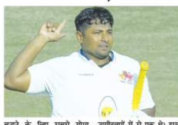
बनाने के लिए सबसे योग्य उम्मीदवारों में से एक थे। इसके

नई दिल्ली। भारत और वेस्टइंडीज 12 जुलाई से मस्टी फॉर्मेट सीरीज में अहमने-सहमने होंगे। इससे पहले बीसीसीआई (भारतीय क्रिकेट कंट्रोल बोर्ड) ने हाल ही में आगामी वेस्टइंडीज दौरे के लिए भारत की वनडे और टेस्ट टीम की घोषणा की। दोनों टीमों के बीच दो टेस्ट मैचों से सीरीज शुरू होगी जिसके बाद तीन वनडे और पांच टी20आई मैचों की श्रृंखला खेली जाएगी। बीसीसीआई के वेस्टइंडीज दौरे के लिए टीम की घोषणा की के बाद 25 वर्षीय सरफराज खान को को टेस्ट टीम के लिए नहीं चुने जाने पर जोरदार प्रतिक्रिया दी है। ट्विटर पर सरफराज को टीम में शामिल न करने के लिए बीसीसीआई को लाताड़ लगाई क्योंकि भारतीय बल्लेबाज निस्संदेह हल ही में रणजी ट्रॉफी में सर्वश्रेष्ठ प्रदर्शन करने वालों में से एक रहें हैं और कई लोगों का मानना है कि वह वेस्टइंडीज दौरे के लिए भारतीय टीम में जगह