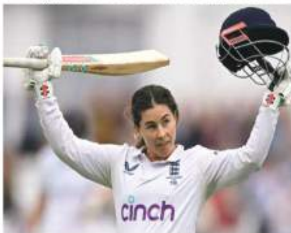
पारी में 473 रन बनाए। ऑस्ट्रेलिया की ओर से एन्केल सदरलैंड ने 184 गेंदों में 137 रन बनाए, वहीं एलिस पेरी अपने शतक से चूक गईं। वह सोफी एक्लेस्टोन ने 5 विकेट चटकए, जबकि लौरन बेल और लौरन फाउलर ने 2-2 विकेट चटकए। इसके अलावा केंट क्रोस ने 1 विकेट हासिल की।

मेलबर्न। ऑस्ट्रेलिया और इंग्लैंड के बीच खेले जा रहे एकमात्र महिला एशेज टेस्ट में इंग्लैंड की सलामी बल्लेबाज टैमी ब्यूमोंट के बल्ले से पहली पारी में शानदार दोहरा शतक देखने को मिला। उन्होंने 331 गेंदों में 208 रनों की पारी खेली। यह उनर यह उनका टेस्ट क्रिकेट में पहला दोहरा शतक भी है, जिसकी मदद से इंग्लैंड ने पहली पारी में 463 रन बनाए। इससे पहले ऑस्ट्रेलिया ने पहले बल्लेबाजी करते हुए पहली पारी में 473 रन बनाए हैं। इंग्लैंड की लिए ओपनिंग करने आई एम्मा लैब कुछ खास नहीं कर पाई और 10 रन बनाकर चलती बनी। इसके बाद टैमी ने कप्तान हीथर नाइट के साथ पारी संभाली। कप्तान नाइट ने 57 रनों की अर्धशतकीय पारी खेली। वहीं नेट साइबर ब्रंट ने भी अपनी अर्धशतक पूरा किया। उन्होंने 78 रनों की पारी खेली। डेनियल व्हाइट ने 44 रन बनाए। ऑस्ट्रेलिया ने पहली पारी ऑस्ट्रेलिया ने अपनी पहली 153 गेंदों में 99 रन बनाकर आउट हुई। तहिला मैकग्रा ने ऑस्ट्रेलिया की ओर से 83 गेंदों में 61 रन बनाए। इंग्लैंड की ओर