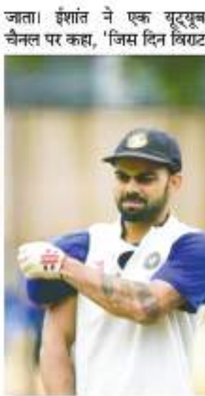
कोहली के पिता का निधन हुआ, वह अकेले और उदास थे, उन्हें

नई दिल्ली। भारत के वरिष्ठ तेज गेंदबाज ईशांत शर्मा ने स्टार बल्लेबाज विराट कोहली के जीवन के सबसे कठिन दौर की खबर कियी। ईशांत और कोहली अपनी क्रिकेट यात्रा की शुरुआत से ही अच्छे दोस्त रहे हैं। दोनों खिलाड़ी एक-दूसरे को अंडर-17 के दिनों से जानते हैं और दिल्ली और भारत के लिए एक साथ खेले हैं। ईशांत ने कोहली के पिता की मृत्यु के बाद खिलाड़ी के कठिन दौर के बारे में खुलकर बात की। तेज गेंदबाज ने कहा कि भारत का पूर्व बल्लेबाज 17 साल की उम्र में बल्लेबाजी करने और मैच जीतने से पहले अकेला और दुखी था। उन्होंने कहा कि उन्हें नहीं पता कि कोहली ने ऐसा कैसे किया और अगर मैं होता तो मैदान पर नहीं